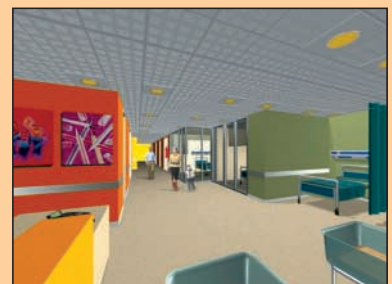
Representación por ordenador de las estancias de las nuevas Urgencias Pediátricas de la Fundación.