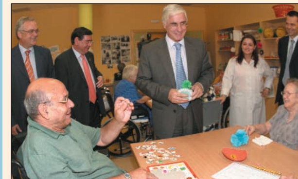
El Presidente de Castilla-La Mancha visitó detenidamente todas las instalaciones y conversó amigablemente con los residentes.