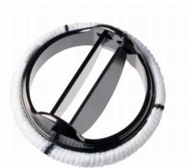
Prótesis mecánica St Jude Regent