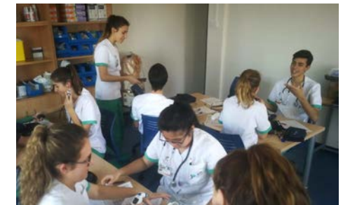
Práctica de Laboratorio: constantes vitales