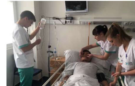
Estudiantes realizando un caso simulado