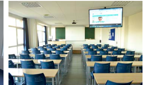
Aula de primer curso