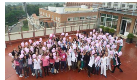
Nuestros estudiantes se solidarizan el día Internacional del Cáncer de Mama

Formamos profesionales diferenciados no solo por su excelencia científica y humana , si no también por su capacidad social y habilidad para el trabajo en equipos de alto rendimiento.