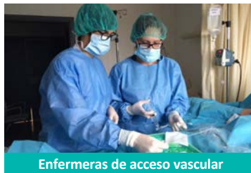
Enfermeras de acceso vascular

Este Máster permite a los estudiantes desarrollar conocimientos y aspectos profesionales relacionados con los cuidados de los accesos vasculares que inciden directamente en la seguridad y bienestar de los pacientes, en los servicios relacionados con el acceso vascular y todas aquellas áreas donde se hace necesaria una enfermera con las competencias y conocimientos que aporta este Máster: área quirúrgica, áreas de exploraciones invasivas (radiología), área preoperatoria (anestesia), áreas médicas con cuidados especializados (oncología, hematología), área pediátrica y neonatal, UVI, urgencias, atención primaria y domiciliaria.