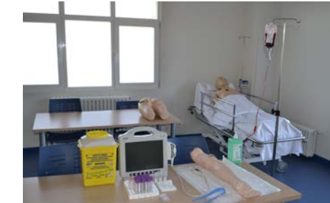
Sala de Simulación de Técnicas Básicas

La Escuela cuenta con aulas dotadas con sistemas multimedia, aula de informática, sala polivalente, biblioteca y salas de prácticas de laboratorio y simulación que facilitan al estudiante la adquisición de competencias.