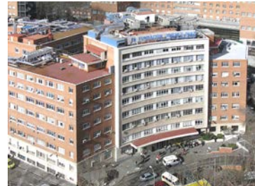
H.U. Fundación Jiménez Díaz

Una de las grandes ventajas del centro es que sus instalaciones se ubican en la quinta planta del edificio de investigación del Hospital Universitario Fundación Jiménez Díaz. Esta situación permite al estudiante vivir su futura profesión desde una visión muy cercana y en uno de los hospitales mejor valorados por los pacientes en la Comunidad de Madrid.