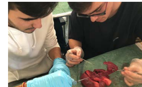
Práctica de Laboratorio: diseccionando un corazón