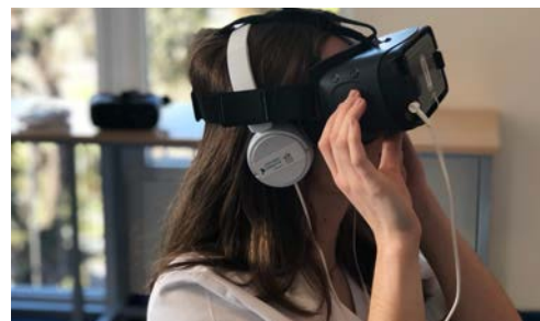
Experiencia de Realidad Virtual en el Quirófano