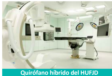
Quirófano híbrido del HUFJD

Permite a los estudiantes desarrollar conocimientos y aspectos profesionales relacionados con los cuidados en anestesia, reanimación y control del dolor. Destaca el volumen de prácticas ofertadas, 386 horas, cubriendo todas aquellas áreas donde la presencia de la enfermera de anestesia es garantía de seguridad y confort para el paciente. Además, la formación teórica se simultaneará con talleres prácticos y simuladores que facilitarán la adquisición de los conceptos.