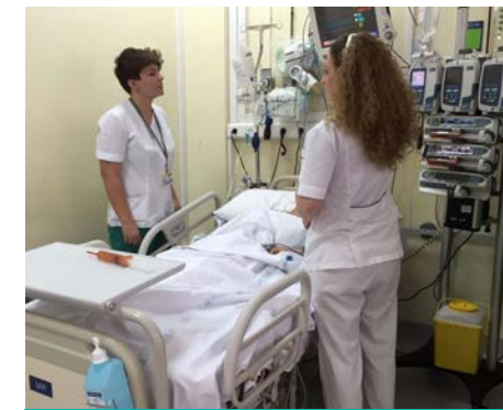
Estudiante realizando prácticas en UCI

Ofrecemos un amplio programa de prácticas con el que garantizamos que nuestros estudiantes realicen estancias clínicas en los distintos entornos asistenciales acompañados de los tutores académicos y profesionales. El centro de prácticas, el Hospital Universitario Fundación Jiménez Díaz, es un hospital de alta complejidad con elevado índice de satisfacción, siendo elegido "mejor hospital de España" por el Índice de Excelencia Hospitalaria en los últimos años