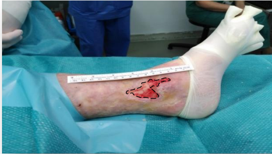
11 abril 2018. Tratamiento