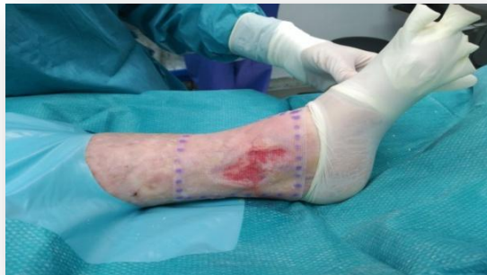
Lámina de fibrina de 115 cm 2 con 2 millones de células MSCs derivadas de grasa

36 millones de células MSCs derivadas de grasa (suspendidas en 3,6 ml) inyectadas en los bordes de la úlcera